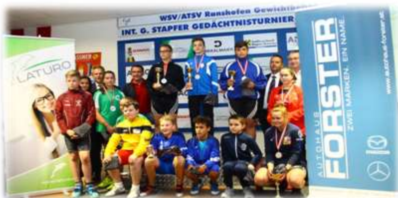
3. Gruppe Frauen 2002,2001 und Männer 2005