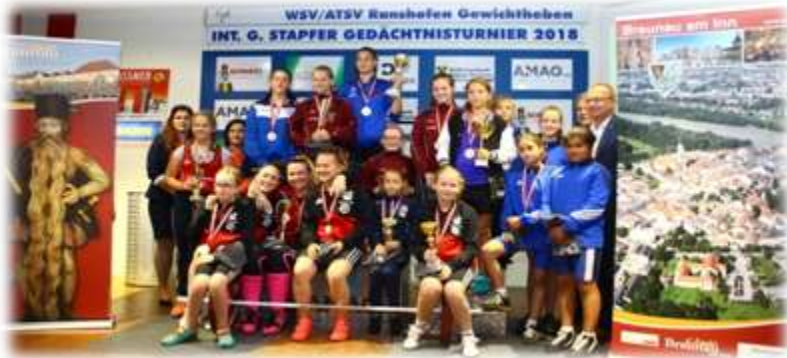
1. Gruppe Frauen 2008,2007,2006,2005,2004