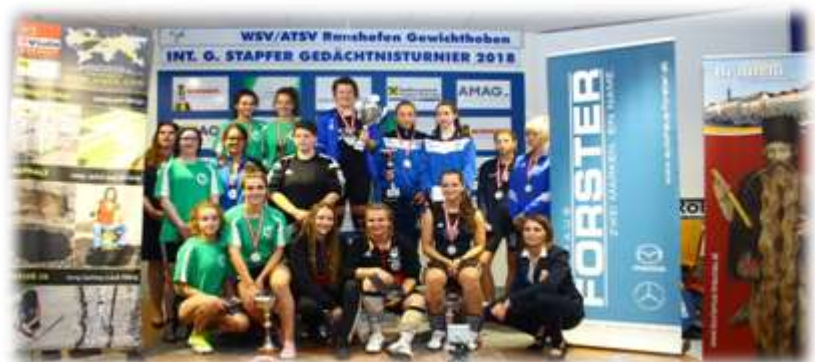
4. Gruppe Frauen 2003,2000,1999,1998,1996