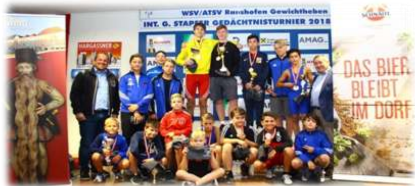
2. Gruppe Männer 2009,2008,2007,2004